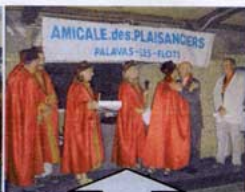
La Confrérie des Amis du Vin Intronise Mr le Député-maire de Palavas-les-Flots