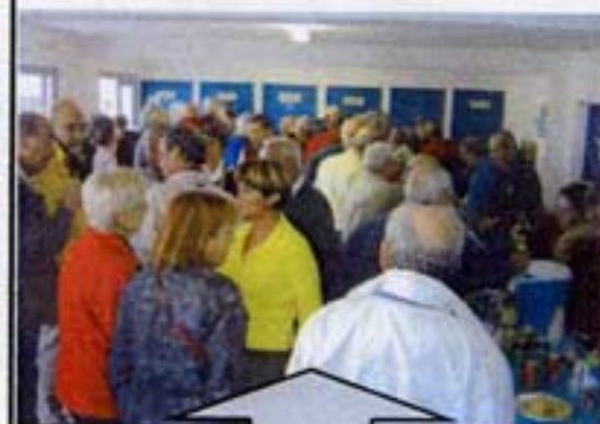
Salle comble pour l'apéritif offert par l'A.P.A.C. Les participants du rallye se sont ensuite retrouvés au restaurant « Le Nautic ».