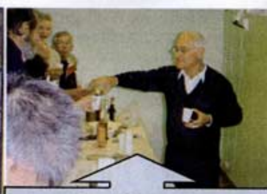
Accueil chaleureux par Mr Le Maire de BOUZIGUES servant le muscat aux équipages et aux invités.